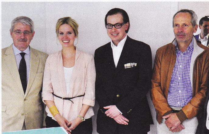
Das Zahnärzte-Team der Praxis für Zahngesundheit.